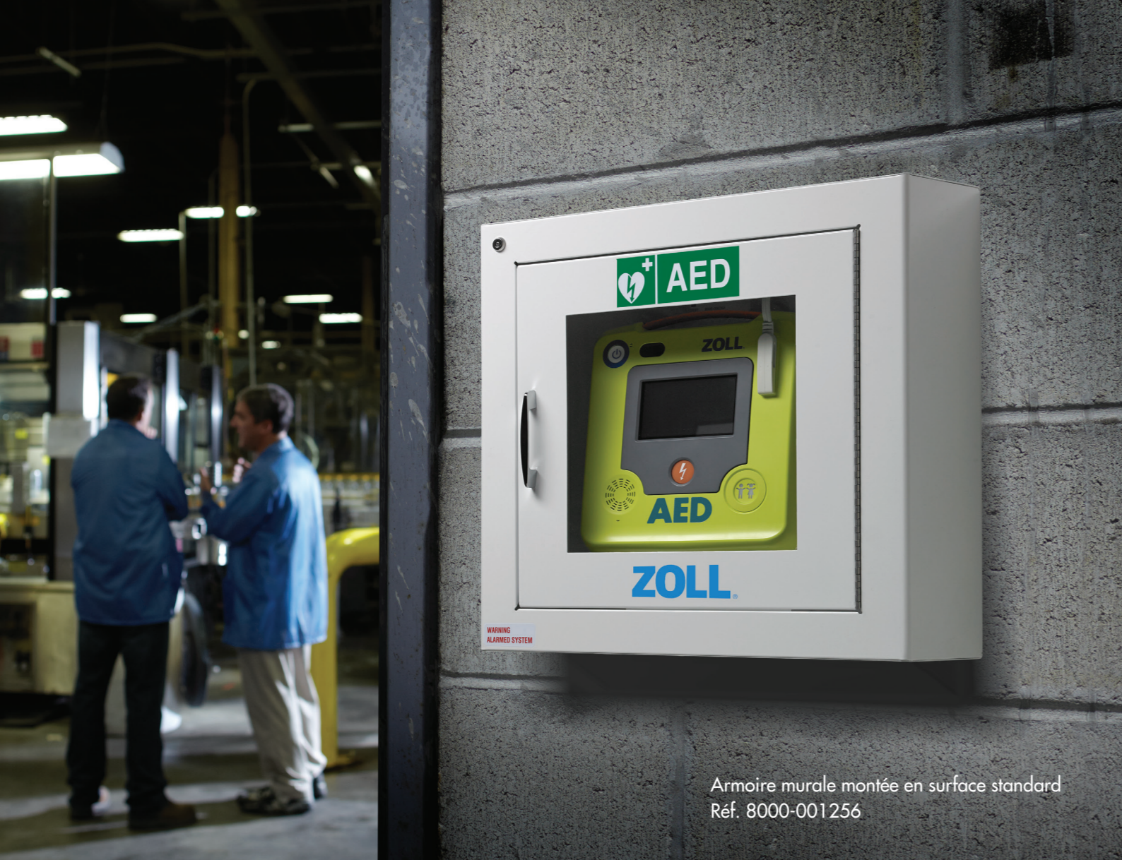
Armoire murale montée en surface standard Réf. 8000-001256