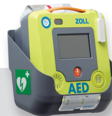
Fixation murale universelle avec le ZOLL AED 3 seul (sans sac de transport) Réf. 8000-001255

La fixation murale universelle sert de support au ZOLL AED 3 seul ou dans sa mallette de transport, et porte une étiquette avec le symbole vert AED ILCOR. Elle comprend du matériel de fixation, une carte de suivi des consommables, un patron de fixation murale et des instructions d'installation.