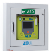
Armoire murale semi-encastée Réf. 8000-001257

Choisissez le modèle monté en surface pour une installation facile, ou bien le modèle semi-encasté ou entièrement encasté pour un rangement moins encombrant. Ces trois modèles comprennent tous un jeu d'étiquettes ILCOR (Comité international de liaison sur la réanimation) pour DAE et des instructions d'installation.