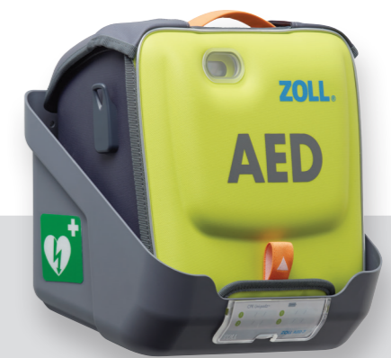
Fixation murale universelle avec le ZOLL AED 3, sa mallette de transport et des électrodes CPR Uni-padz de réserve (dans la mallette de transport) Réf. 8000-001266