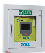
Armoire murale entièrement encastée Réf. 8000-001258